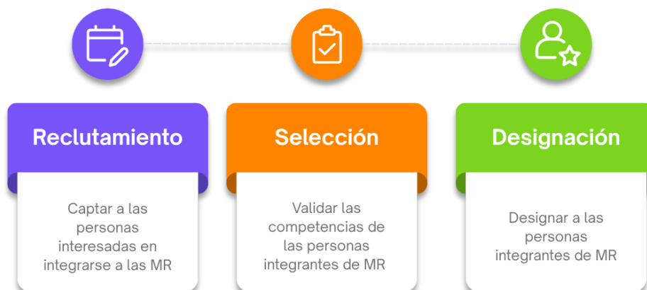
Imagen 1. Etapas del procedimiento

Las etapas del procedimiento comprenden el reclutamiento, selección y designación de las personas aspirantes que cumplen con todos los requisitos y etapas, para que el órgano correspondiente integre las MR .